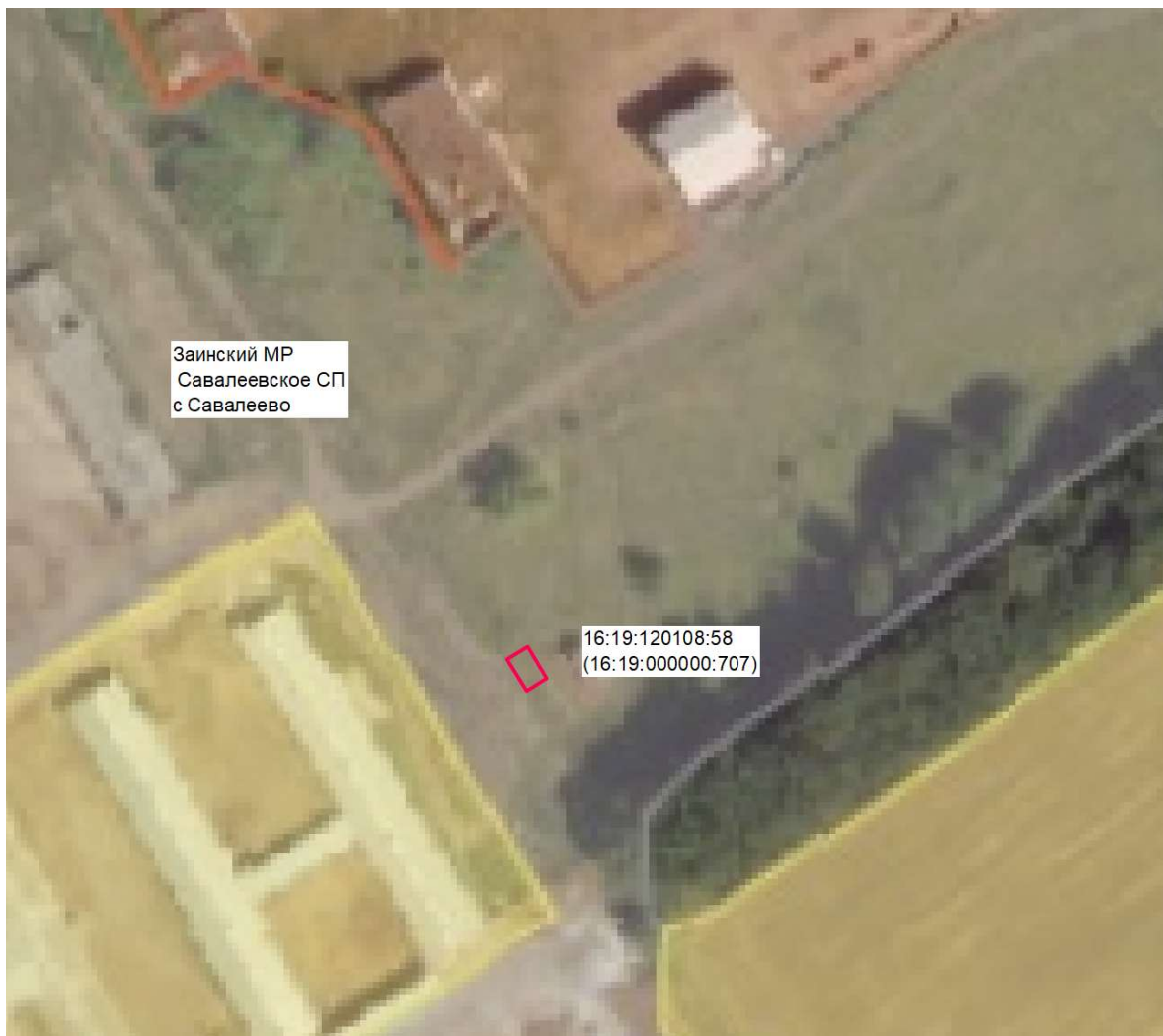
Схема расположения границ публичного сервитута в целях размещения линейного объекта газоснабжения регионального значения "Техническое перевооружение ГРП № 17 в н.п. Савалеево Заинского района РТ Обзорная схема границ объекта