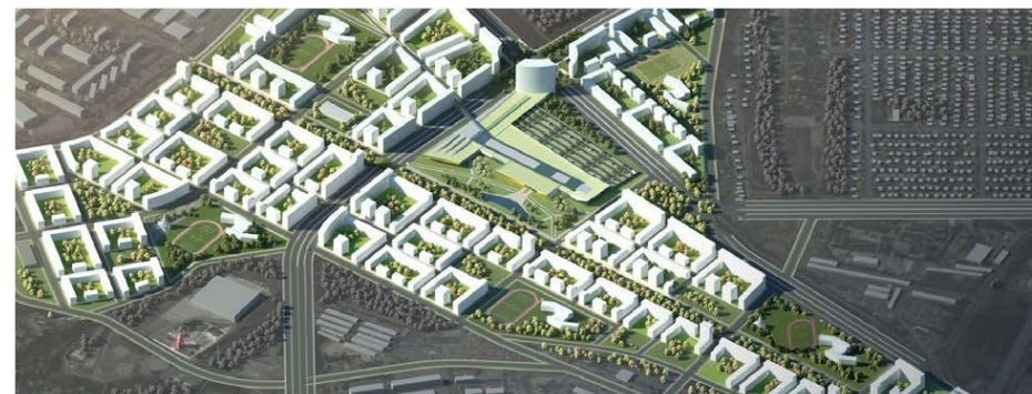
Эко-квартал «Русская Европа» в Калининграде