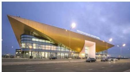
Аэропорт в Перми