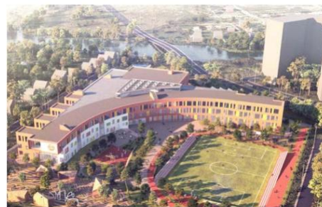
Школа/садик на 1100/220 мест в Коммунарке

Длительность и стоимость строительства любого сооружения, а также срок его жизни не позволяют регулярно перестраивать его по своему желанию или в попытках нагнать постоянно сменяющиеся нужды окружающего мира. Поэтому очень важно строить так, чтобы каждое пространство могло трансформироваться под различные сценарии использования. Здания и прилегающие к ним территории должны быть адаптивными, максимально функциональными. Например, холл школы или детского сада может быть не просто большим пространством с дверями, где много детей одновременно могут переобуться и отправиться на занятия. При наличии атриума и открытого амфитеатра, холл может стать зоной общения, пространством развития, местом для общих мероприятий.