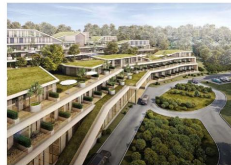
Гостиница в поселке Янтарный

Тяжелые и унылые коридоры офисов и больниц XX века уходят в прошлое, уступая место архитектурной терапии. Сегодня даже врачи ставят перед зодчими задачи создавать лечебные здания, в которых действительно приятно находиться. Вместо мыслей о долгом и трудном лечении, современные медицинские пространства формируют позитивный настрой, заряжают и высвобождают жизненную энергию, поддерживают человека в его стремлении быть здоровым. В помещениях, наполненных светом и воздухом, с элементами природной среды, чувствуешь себя совсем по-другому. В таких зданиях действительно стены помогают.